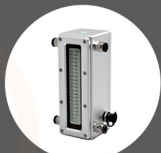
机器视觉 静力水准仪