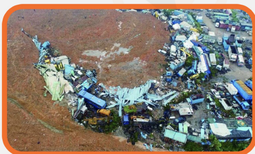
地质灾害 自动化监测