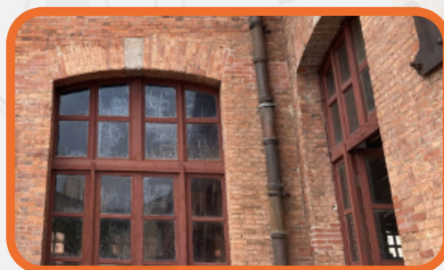
建筑物 自动化监测